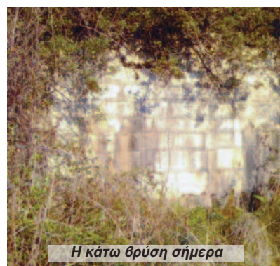
Η κάτω θρύση σήμερα

γκαιότητα, τα πηγάδια κι οι βρύσες του κάθε τόπου έχουν να κάνουν με την ιστορία του και την παράδοσή του.