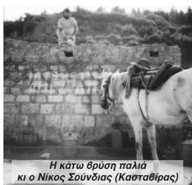
Η κάτω θρύση παλιά κι ο Νίκος Σούνδιας (Κασταθίρας)

Καλό είναι λοιπόν η προσπάθεια που ξεκίνησε απ' το Σύλλογο Επαγ-